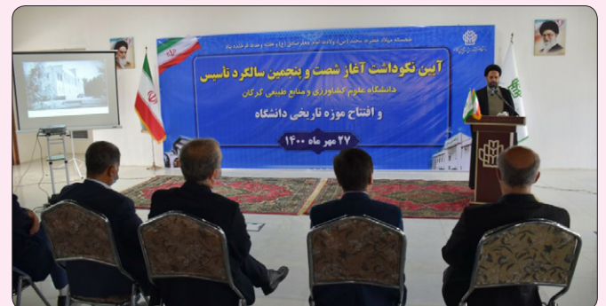
مسئول نهاد نمایندگی مقام معظم رهبری در دانشگاه در آیین نکوداشت آغاز شصت و پنجمین سالگرد تاسیس دانشگاه علوم کشاورزی و منابع طبیعی گرگان

وی در پایان بر ارتباط هر چه بیشتر دانشگاه‌ها با صنعت و لزوم مداخله دانشگاه‌ها در تصمیمات مربوط به جامعه تاکید کرد و افزود: نیاز است تا شرایطی فراهم شود که پیشرفت‌های علمی دانشگاه‌ها، در سطح جامعه اثرگذار باشد و به رفع مشکلات کمک کند.